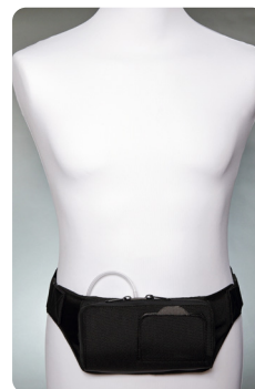
Midjeväska svart (tyg)