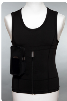
Linne svart XS-3XL