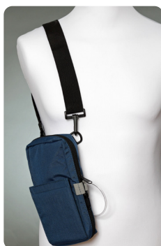
Smith's axel/midjeväska svart eller blå