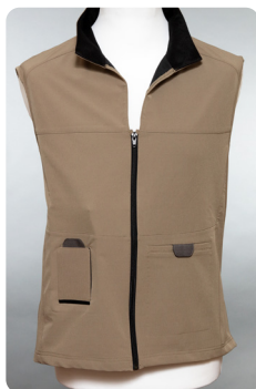
Väst beige XS-3XL

Eftersom Duodopabehandlingen är en långtidsbehandling kan det vara värdefullt att variera sätten som pumpen bärs på. Det finns olika modeller och storlekar vilket framgår av artiklarna nedan. Materialet beställer du kostnadsfritt via Duodopa Support.