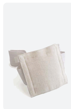
Magsondhållare skydd för PEG-sond nattetid