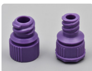
Adapter- ENFit (för sondmat i PEG)

Ring eller maila in din beställning på: 020-50 60 50 eller info@duodopa.se