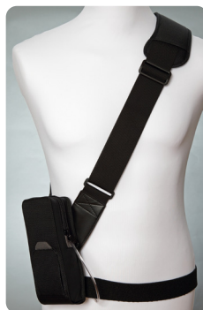
Axelväska svart med midjeband