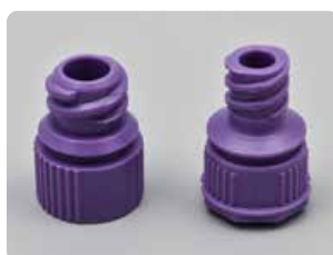
Adapter- ENFit (för sondmat i PEG)

Ring eller maila in din beställning på: 020-50 60 50 eller info@duodopa.se