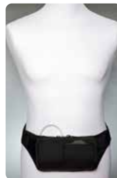
Midjeväska svart (tyg)