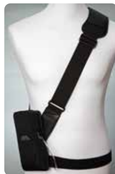
Axelväska svart med midjeband