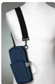
Smith's axel/midjeväska svart eller blå