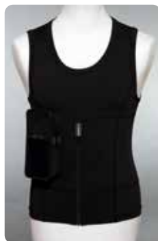
Linne svart XS-3XL