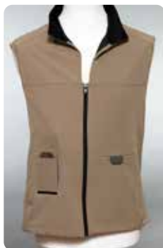
Väst beige XS-3XL

Eftersom Duodopabehandlingen är en långtidsbehandling kan det vara värdefullt att variera sätten som pumpen bärs på. Det finns olika modeller och storlekar vilket framgår av artiklarna nedan. Materialet beställer du kostnadsfritt via Duodopa Support.