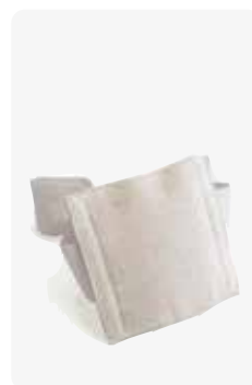
Magsondhållare skydd för PEG-sond nattetid